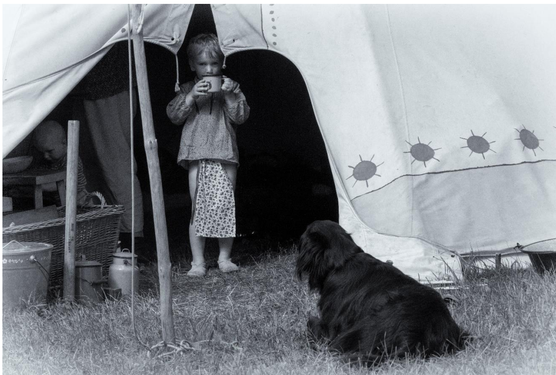
z táboření na Kosím potoce