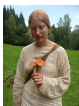
houby byly všude