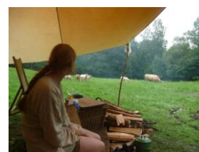
Navštívili nás kravičky