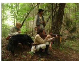
lov na medvěda