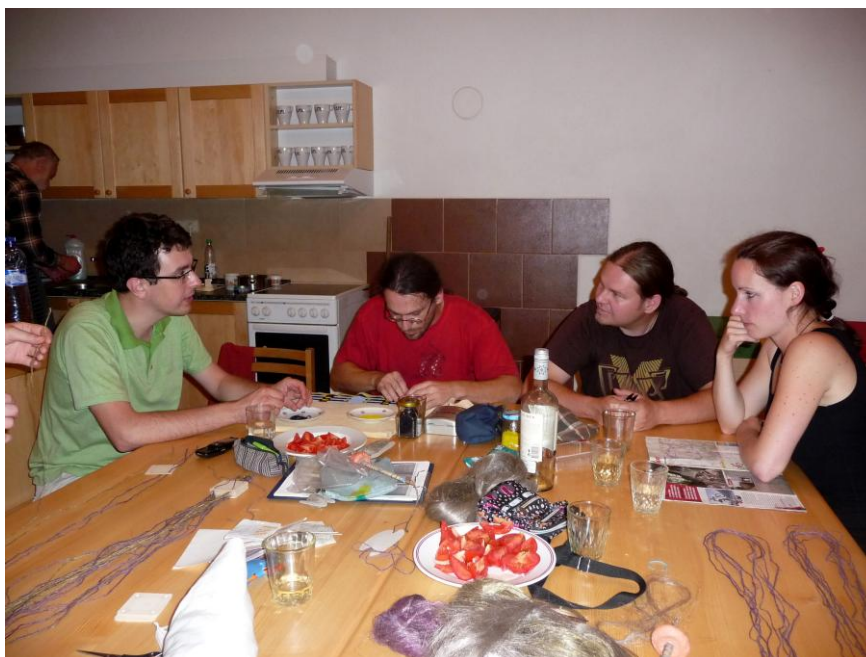
na turistické ubytovně LLM - FRAM