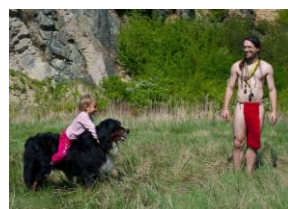
nejmenší děti si užívali Indouška