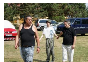
soutěží se zúčastnili i hendikepované děti