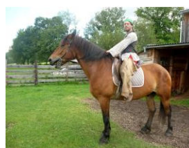
vyjeli jsme na koních