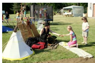
soutěž v trefování se míčku do týpí