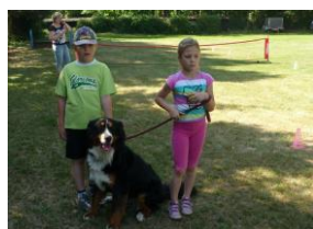
děti si hrály s pejsky

výpomoc s dnem dětí společně se kynologickým klubem ze Sendražic v Kolíně